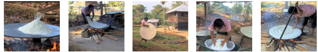
( ) La farine est déposée sur la platine ( ) La galette est retournée ( ) Après la cuisson elle est mise à sécher ( ) Remplissage du tamis avec de la farine ( ) Répartition de la farine sur la platine

7. Numérote les différentes phases de fabrication de la cassave.