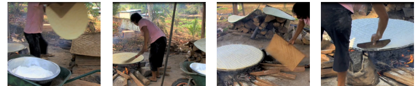
( ) Dépôt de la galette cuite sur une natte ( ) Dépoussiérage en fin de cuisson ( ) Atisage du feu avec éventail à feu ( ) Ajustement des bords avec spatule

8. La couronne est réalisée avec les plumes de quels oiseaux ?