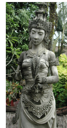
Statue représentant Dewi Sri

Depuis ce temps-là, Dewi Sri est vénérée comme la déesse du riz, de l'abondance et de la fertilité.