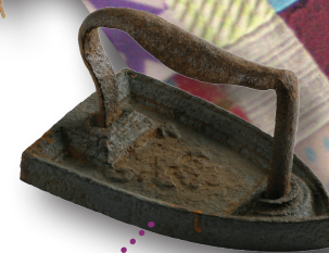
Fer à repasser fer