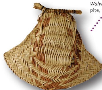
Eventail Walwari pite, foliole de palmier mouroumourou