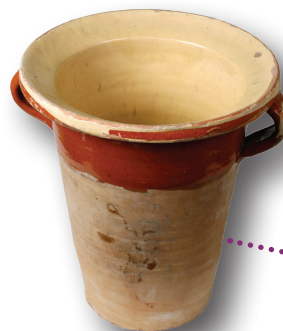
Pot de chambre Azor terre cuite, vernis