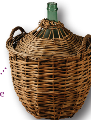
Dame Jeanne verre, arouman