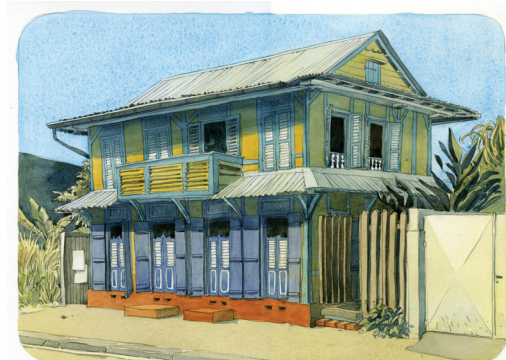
54 rue Madame Payé - Cayenne -

A l'étage, un balcon permet de " prendre le frais " et de profiter de l'animation de la rue. La maison dialogue avec la ville : un jeu de portes, de fenêtres à persiennes et d'impostes ajourées favorisent la ventilation et permettent de réguler la lumière.